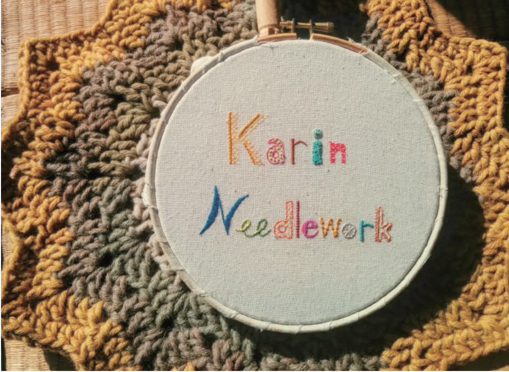
Karin Needlework の看板 (屋号)